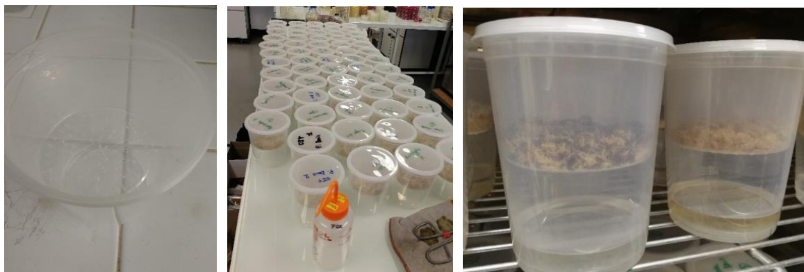
Figure 1. Photos du dispositif

Le spray contenant les souches est formulé avec un mélange d'eau stérile avec 0.01 M/L de MgSO_4 et 0.25 % du tensioactif Twin 20. L'ajout du tensioactif est indispensable pour que les spores hydrophobes ne collent pas aux parois du matériel. Le sulfate de magnésium permet maintenir l'isotonie de la solution d'extraction. Ce mélange est utilisé pour récupérer les spores sur les boîtes de culture en milieu solide.