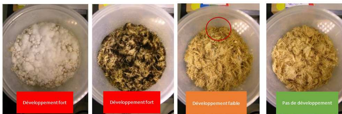
Figure 2. Grille d'évaluation visuelle

Les boîtes fermées sont ensuite conditionnées pendant 28 jours à 25 °C dans une étuve pour la phase d'incubation. La présence d'eau dans le fond de la boîte pendant toute la durée de l'incubation est vérifiée. Au bout de 28 jours, les boîtes sont ouvertes et les fibres sont observées à l'œil et au microscope pour voir s'il y a eu ou non un développement fongique (Fig.2). Chaque boîte est également photographiée avant et après l'incubation.