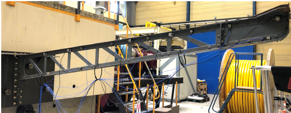
FIGURE 3. Poutre treillis instrumentée avec 12 accéléromètres pour les essais vibratoires.