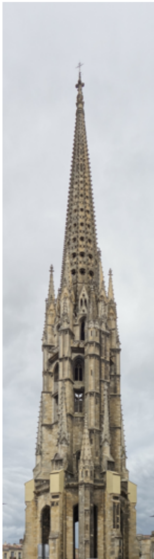
FIGURE 1. FSM

crochets forment les sommets du dodécagone (selon une alternance toutes les 3 assises) tandis que des panneaux de maçonnerie forment les arêtes. En partie basse, les panneaux sont perforés de petits oculi polylobés. En partie supérieure, 3 séries d'ouvertures oblongues courent sur 4 à 5 assises (1,30 à 1,65 m de haut) et occupent plus ou moins la largeur totale des panneaux. La pierre utilisée pour la construction de la flèche est une pierre calcaire dite « bâtarde du Périgord » jointoyée avec un mortier de chaux. La partie sommitale de la flèche est surmontée par un fleuron massif de près de 22 tonnes et une croix maintenue par une enrayure métallique située 13m en dessous du fleuron et scellée dans la maçonnerie.