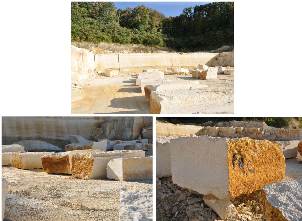
FIGURE 2. Pierre calcaire du gisement de Saint Maximin dans l'Oise.

Plusieurs nombres de côtes dimensionnelles sont possibles, cela en fonction de l'épaisseur des éléments demandés pour le chantier. Les dimensions peuvent être « standard » avec la même épaisseur, ou sur mesure (Figure 3). Les éléments en pierre sont coupés à sec ou à l'eau : guillotine multi-lame, grand disque, et/ou machine 5 axes à l'eau et ordonnées à l'échelle industrielle.