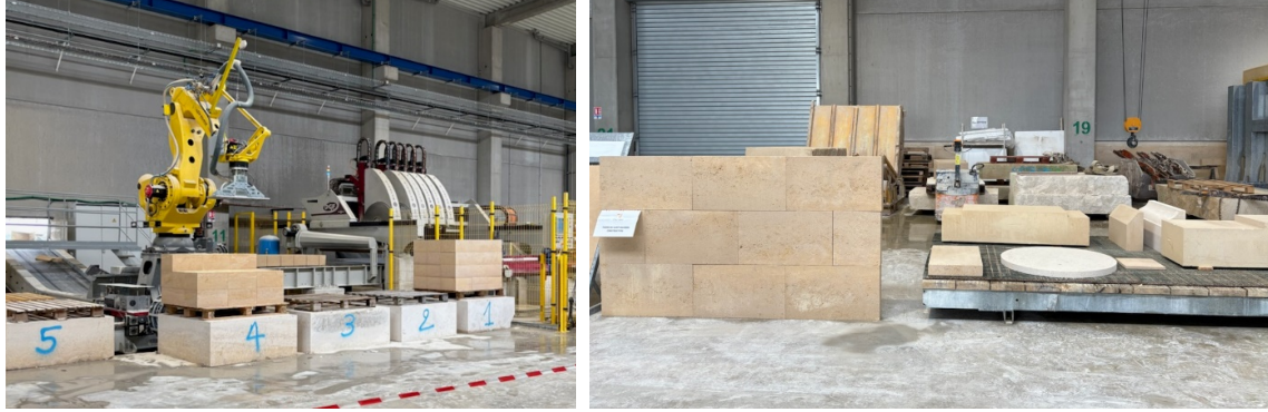
FIGURE 3. Éléments standards et éléments sur mesure. Source Polycor France (Rocamat)

Cette technique n'est en définitive qu'un pré-assemblage par modules par ouvriers-poseurs spécialisés ; la pierre prétaillée n'est qu'un matériau de gros œuvre des murs porteurs ou des façades, principalement pour des constructions courantes et traditionnelles.